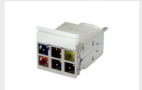
BKS Ref. 408-5861/26

Kompakteste Buchse für optimierten Einbau in Anschlussdosen Einteiliges, wiederbeschaltbares Design Anschlusstechnik für schnelle und einfache Montage Montage ohne Spezialwerkzeuge Rückwärtskompatibel zu Standard Panels und Auslässen Dank 6P Ausführung erweiterte cable-sharing Möglichkeiten GHMT zertifiziert